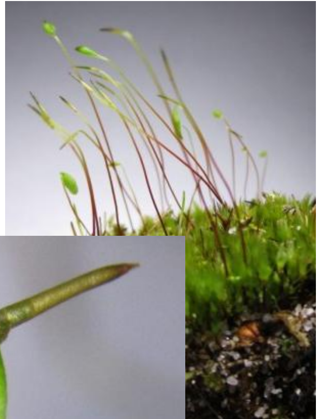
allemaal gewoon peermos